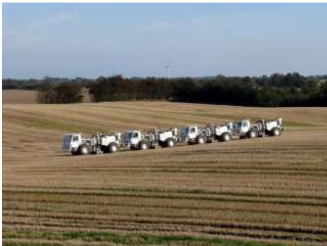
Munkatársaink ilyen önjáró vibrátor járművekkel keltenek mesterséges rezgéseket

Az engedélyeztetésért felelős bányászati, geológiai kutatási és tanácsadó tevékenységre specializálódott magyar cég, a TDE Services Kft. minden illetékes hatóságot megkeresett a szükséges engedélyek beszerzéséért, a kutatással érintett ingatlantulajdonosokat és -használókat pedig levélben értesítette, majd személyesen is felkeresi.