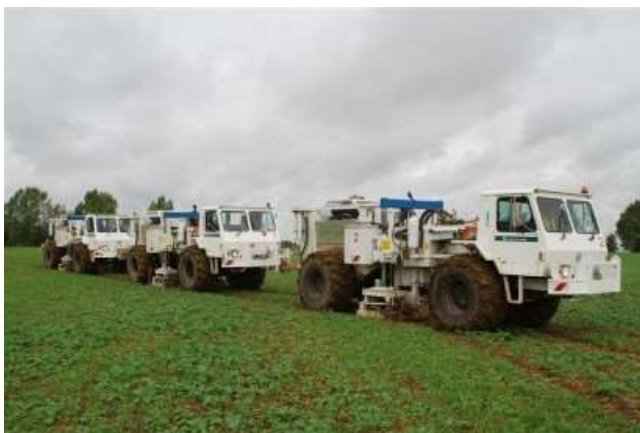
Ilyen önjáró vibrátor járműveket láthat a kutatási területen